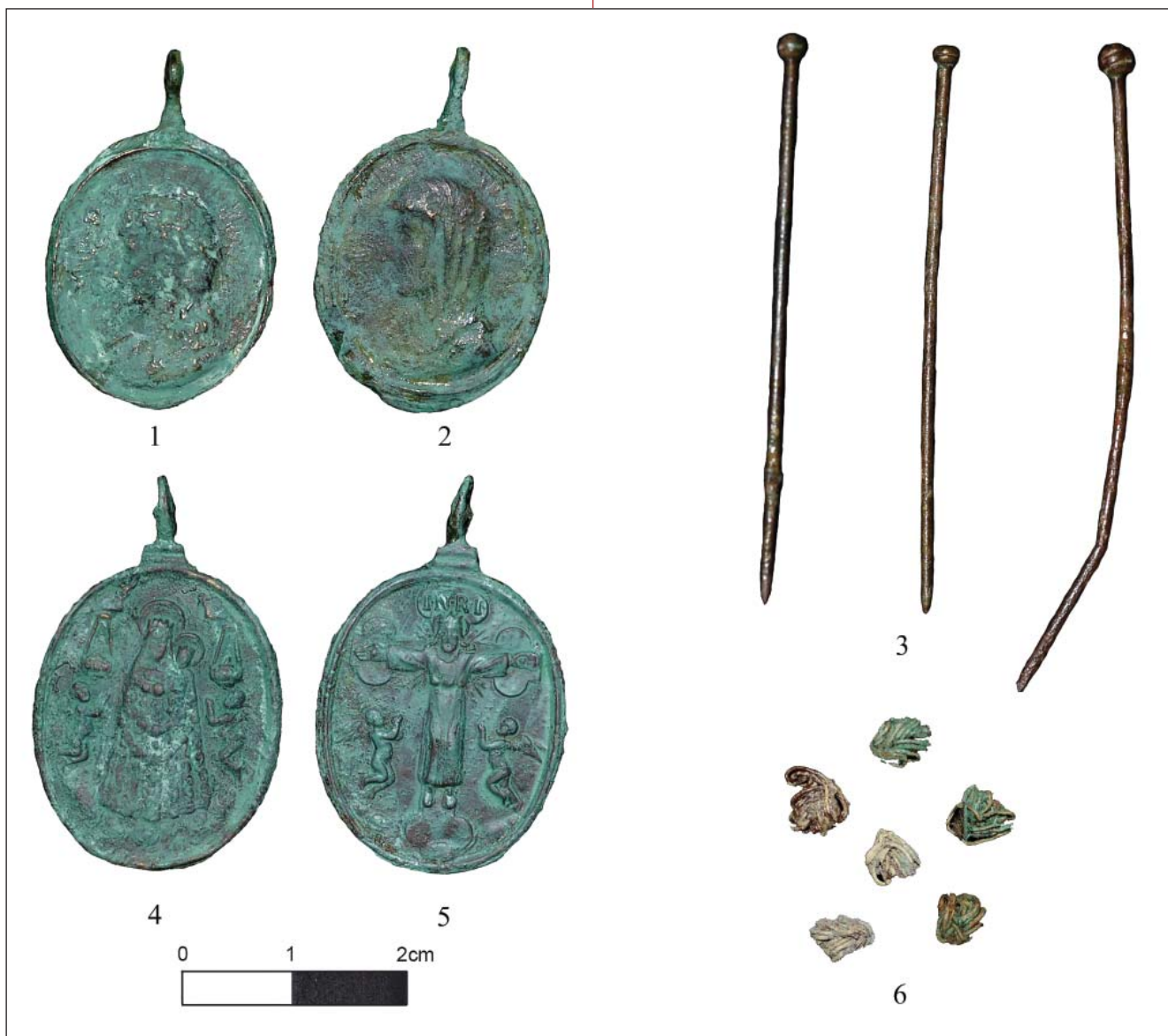
6. Прилози из гробова са некрополе Паланка: 1–2) Свећачка медаљица из гроба 1/2014; 3) уокоснице и 4) медаљица из гроба 5/5014; 6) делови златићевеза из гроба 2/2014 (J. Вулејић и М. Радмиловић)