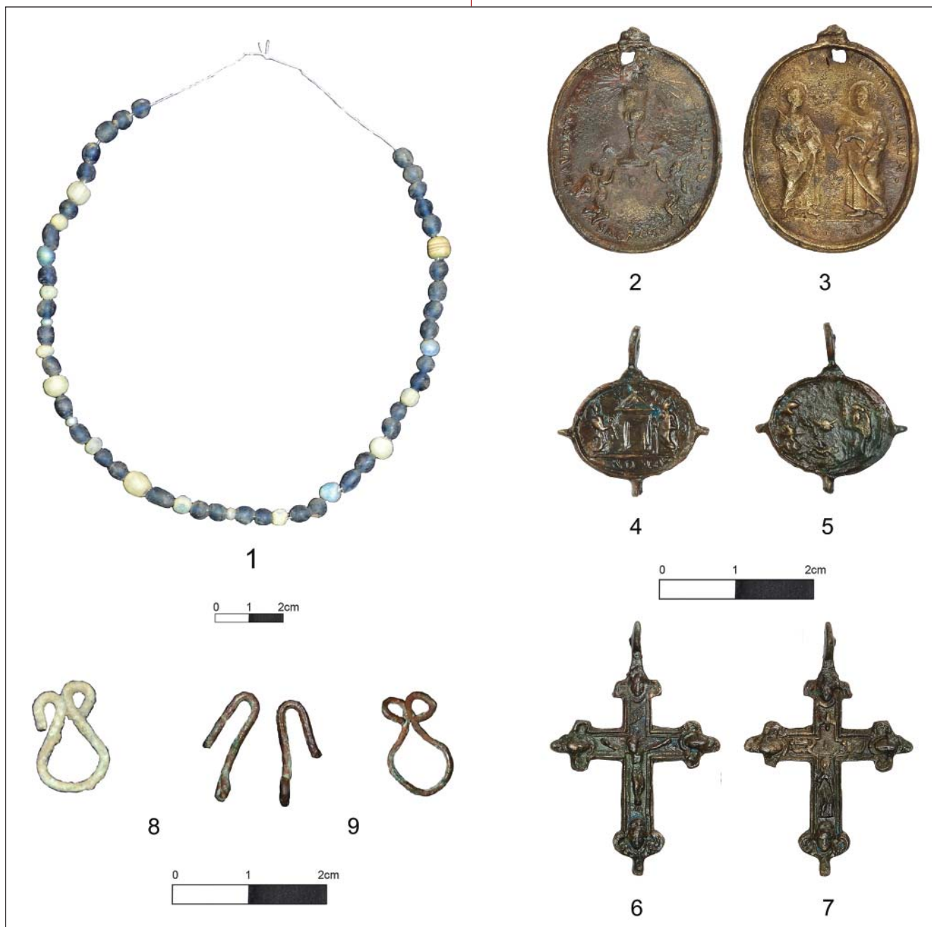
8. 1) Круница, 2–5) медаљнице и 6–7) крсти из гроба 9/2016; 8) койча из гроба 11/2016; 9) две койче из гроба 8/2014 (J. Вулејић и М. Радмиловић)