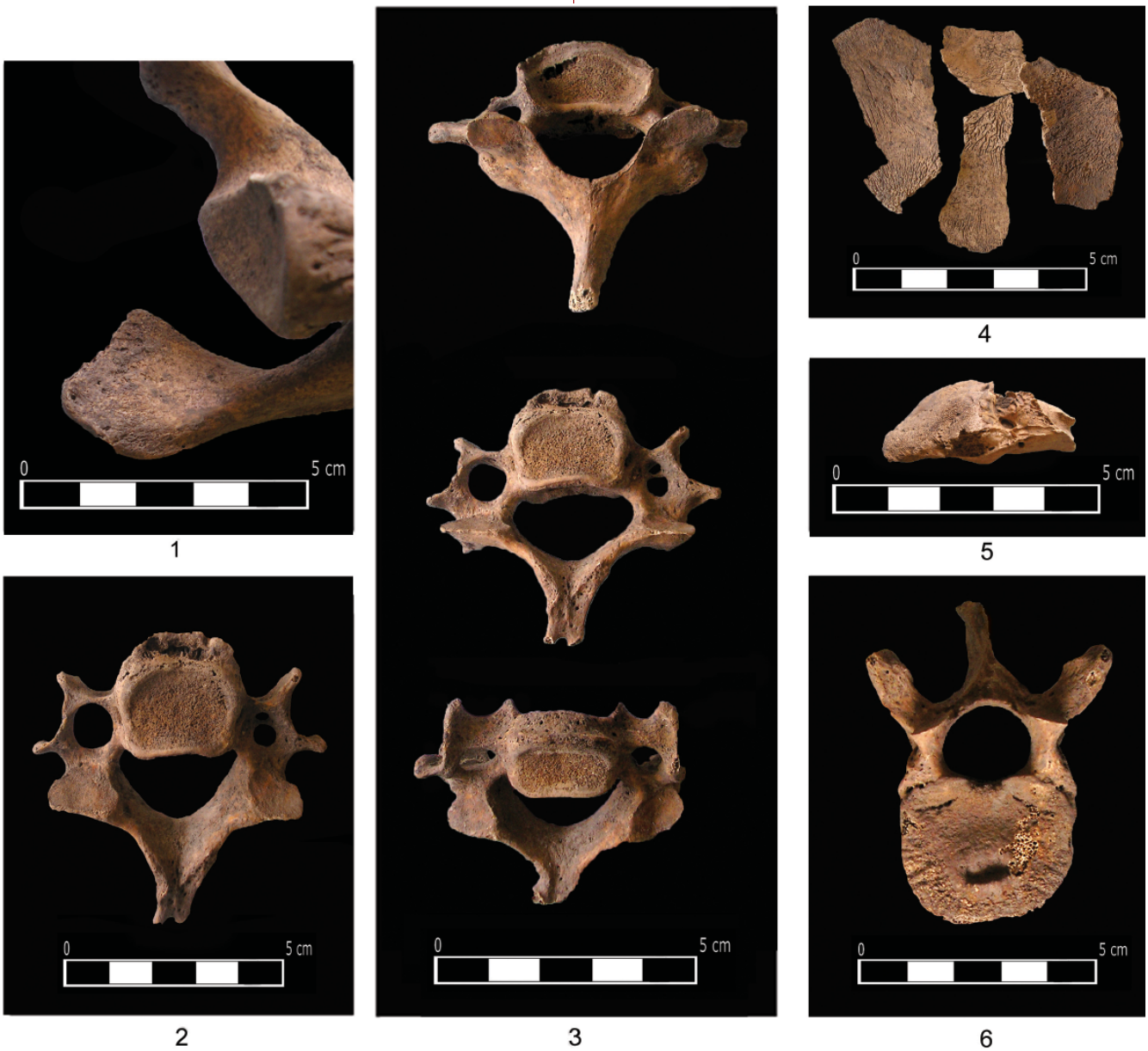
4. 1) појава os acromiale (гроб 1/2014); 2 и 3) остеофицити и foramen processus transversi bipartitum на вратним пршљеновима (гроб 1/2014); 4) порозичне лезије на фрагментима фронталне и париејталних костију (гроб 2/2014); 5) порозичне лезије на фрагменту темпоралне кости (Гроб 2/2014); 6) Шморлов дефект на грудном пршљену (гроб 4/2014)