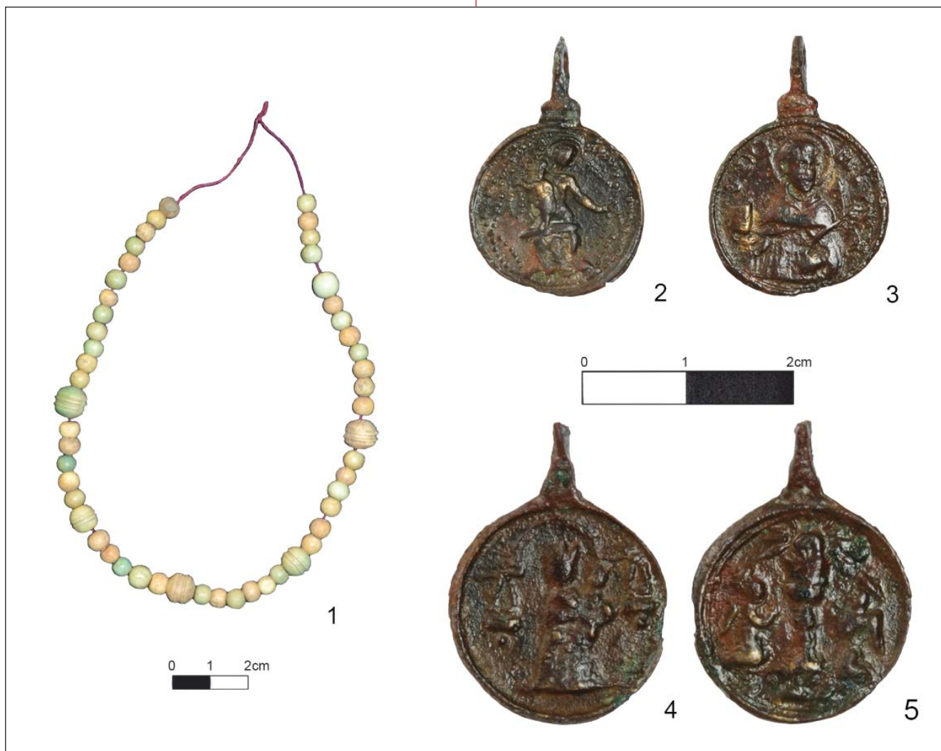
7. 1) Круница и 2–5) медаљнице из гроба 11/2016 (J. Вулеџић и М. Радмиловић)